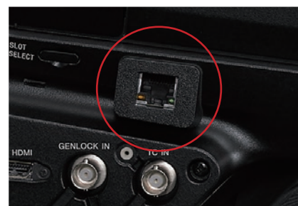
嵌入式 RJ-45 接口