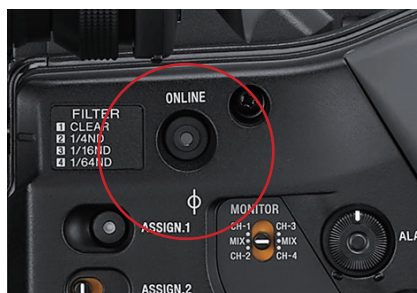
ONLINE (在线) 按键