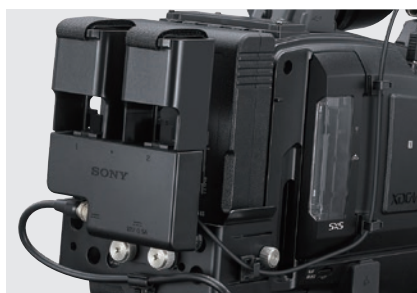
连接到新型摄录一体机上的CBK-DL1

为了对ENG/EFP工作流程提供有效支持, PXW-Z750还内置有无线功能。包括ONLINE (在线) 按键操作。本摄像机可提供简单的代理传输操作。这一性能对于4K节目制作非常有用。而且, 它还允许用户在进行拍摄时传输流媒体影像。此外, 使用CBK-DL1, 用户可以连接两个USB连接器, 从而更稳定地传输流媒体影像。